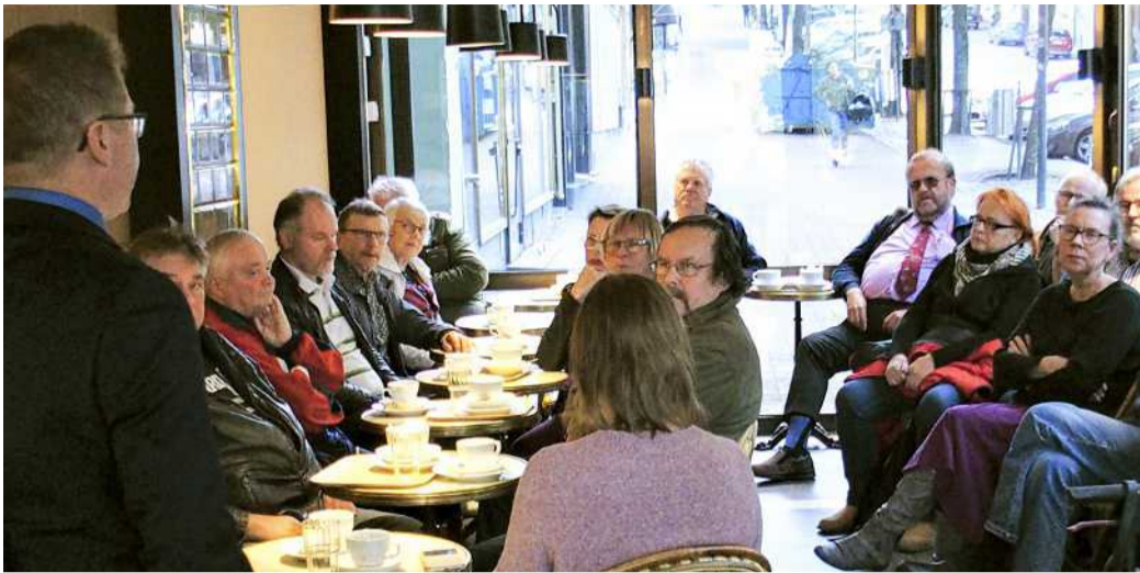
Lahden keskustakahvilaan saapui runsaasti joukkoliikenteestä ja liikennetarkkaisuista kiinnostunutta yleisöä keskustelemaan ja kyselemään Lahden Perussuomalaisten järjestämään tupailtaliisuuteen.