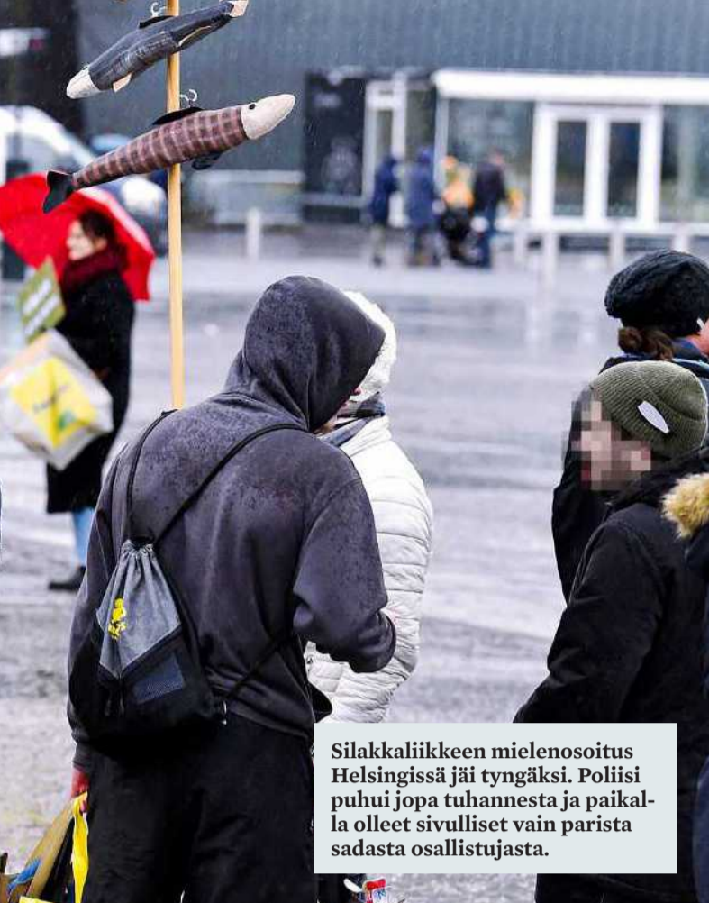
Silakkaliikkeen mielenosoitus Helsingissä jäi tyngäksi. Poliisi puhui jopa tuhannesta ja paikalla olleet sivulliset vain parista sadasta osallistujasta.