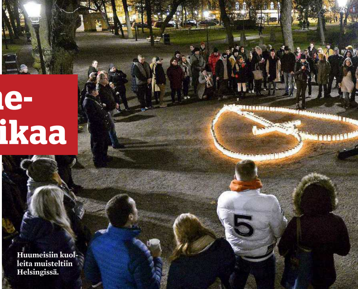
Huumeisiin kuolleita muisteltiin Helsingissä.

jiä ja on tietoinen huumeiden saatavuudesta, vaikkei itse käyttäisi niitä. Huumeikaupan siirtyessä verkkoon lähes kuka tahansa voi ostaa niitä nimettömästi pelkästään älypuhelimella. Sitä kautta ne myös tulevat yhä nuorempien ikäryhmien saataville ilman, että heidän lähipiirinsä välttämättä edes on asiasta