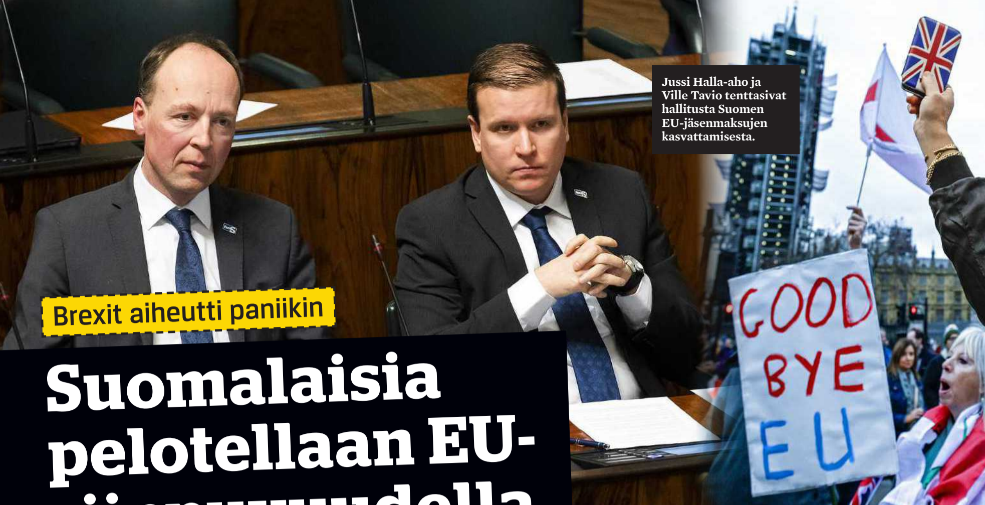
Jussi Halla-aho ja Ville Tavio tenttasivat hallitusta Suomen EU-jäsenmaksujen kasvattamisesta.