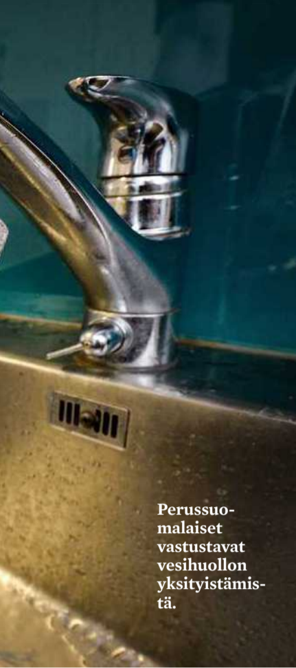
Perussuomalaiset vastustavat vesihuollon yksityistämistä.

kansallisomaisuuttamme ovat myös maaperämme malmimineraalit.