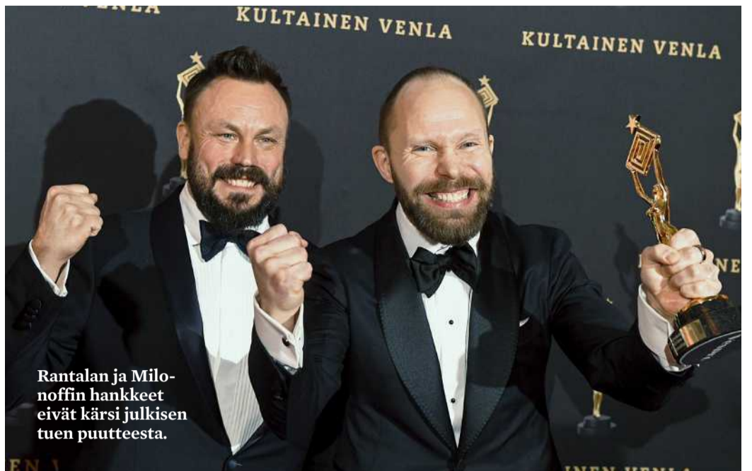
Rantalan ja Milonoffin hankkeet eivät kärsi julkisen tuen puutteesta.

Suomi-Somalia Seuralle heltisi STEA:lta mukavat 115 000 euroa. Rahat käytetään seuran mukaan suomensomalialaisten yrittäjyys- ja työllistymisedellytyksien edistämiseen kohderyhmälle räätälöidyn kurssin, työharjoittelun, mentoroinnin sekä yrityshautomon ja neuvonnan avulla.