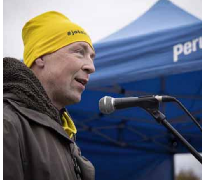
Puheenjohtaja Jussi Halla-aho puhuu ja kansa kuuntelee. Teuvallakin oli lauantai-iltapäivällä tori tupaten täynnä. Kuvituskuva