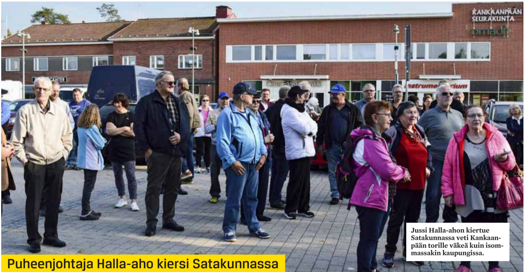
Puheenjohtaja Halla-aho kiersi Satakunnassa