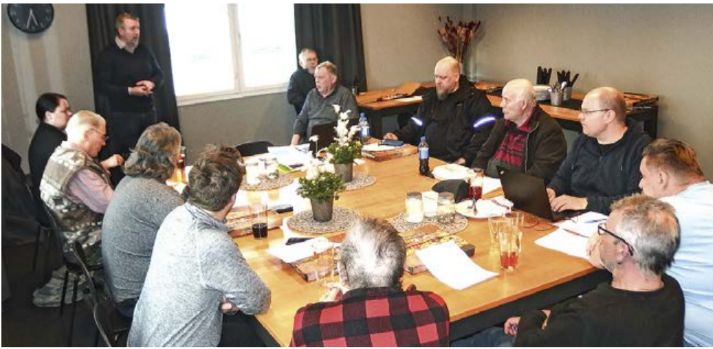
Keuruun Perussuomalaisten kevätkokous oli sikäli historiallinen, että tänä vuonna kokous pidettiin perinteisen kokouspaikan sijasta keilahallinakin tunnetun Keuruun Liikelataamon tiloissa.