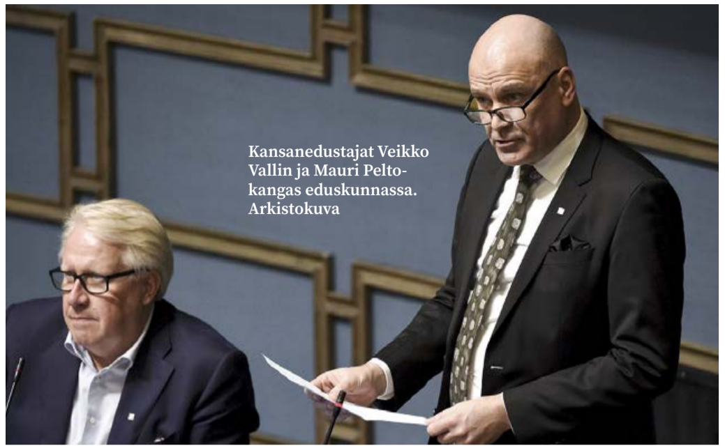
Kansanedustajat Veikko Vallin ja Mauri Peltokangas eduskunnassa.