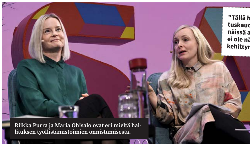
Riikka Purra ja Maria Ohisalo ovat eri mieltä hallituksen työllistämistoimien onnistumisesta.

"Tällä hallituskaudella näissä asioissa ei ole nähty kehittymistä."