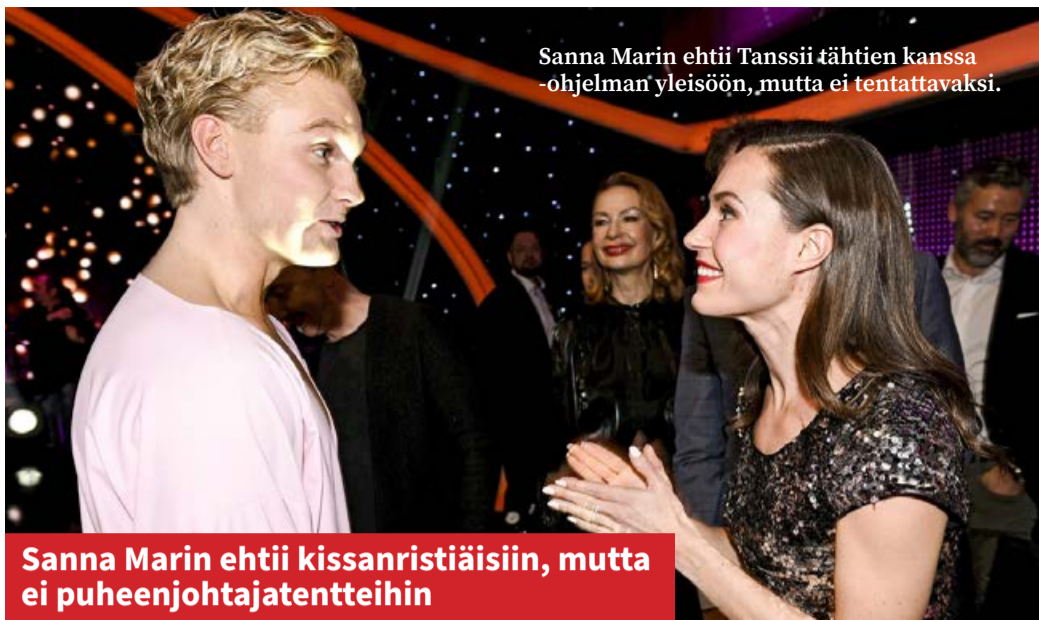
Sanna Marin ehtii Tanssii tähtien kanssa -ohjelman yleisöön, mutta ei tentattavaksi.

kyisin Yle käyttää miljoonia euroja esimerkiksi ulkomaisien viihdesarjojen esitysoikeuksiin, urheilutapahtumiin sekä ideologisiin ohjelmatuotantoihin, ja kaikkien osalta voidaan kysyä, onko perusteltua pakottaa suomalaiset näitä maksamaan. Suomalaiset joutuvat kiristävät vöitään – ja Ylen tulee osallistua talkoisiin, hallintoneuvoston jäsenet esittävät.