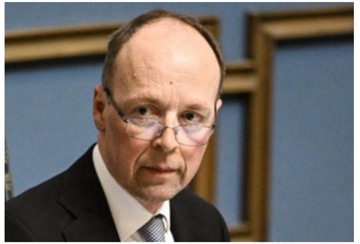
Eduskunnan puhemieheksi valittu Jussi Halla-aho: