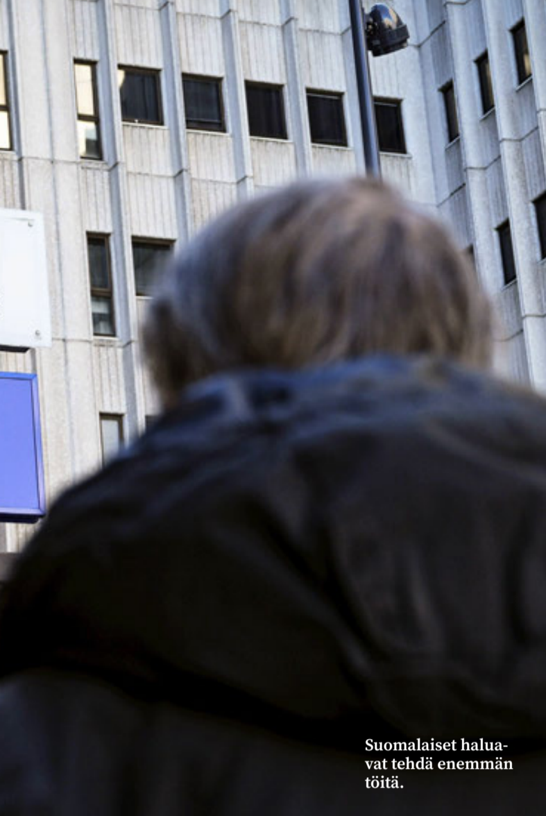
Suomalaiset haluavat tehdä enemmän töitä.

tuntiduunari singahtaa pois työttömien joukosta.