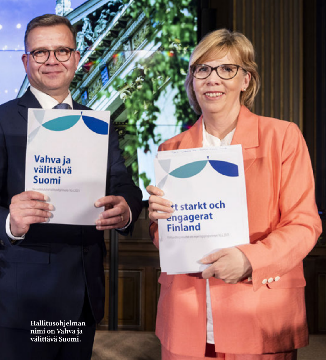
Hallitusohjelman nimi on Vahva ja välittävä Suomi.