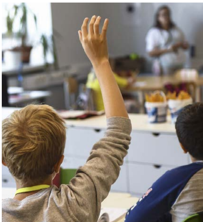
Väkivalta ja sen uhka koskee yli puolta opettajista. Iso osa opettajista harkitsee myös alanvaihtoa.

■ TEKSTI SUOMEN UUTISET