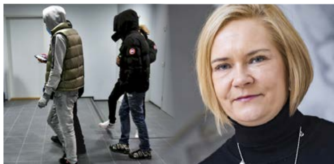
Perussuomalainen sisäministeri puuttuu jengiväkivaltaan uusien ottein.

"Meidän tulee ryhtyä säästämään ja lopettamaan tuhlaaminen."