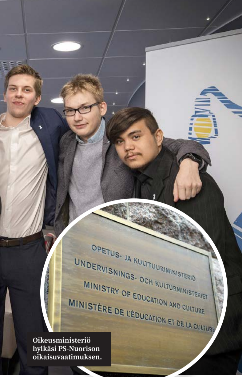
Oikeusministeriö hylkäsi PS-Nuorison oikaisuvaatimuksen.

eduskuntapuolueiden nuorisjärjestöt saivat valtiontukia noin 2,6 miljoonan euron edestä vuonna 2023 seuraavasti: