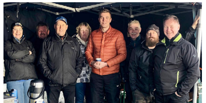
Kaskisten Silakkamarkkinoille osallistuneet perussuomalaiset joutuivat taistelemaan syysmyrskyä vastaan perussuomalaisen sanoman eteenpäinviemiseksi.

Lauantaina keskustelut ihmisten kanssa jäivät vähäisiksi, kun tuulta vastaan taisteltiin niin voimallisesti. Sunnuntaina sitten oli enemmän keskusteluita, joissa sivuttiin monia asioita hallitusohjelmasta. Keskustelua herättivät erityisesti bensiinin sekä dieselin hinta, nuorten opiskelijoiden toimeentulo sekä tietönsä kunto. Paikallisista asioista keskustelua käytiin mm. Kaskisiin mahdollisesti tulevasta Metsän kartonkitehtaasta, joka olisi todella toivottu piristys koko Suupohjan alueelle. Toinen suuri asia, joka