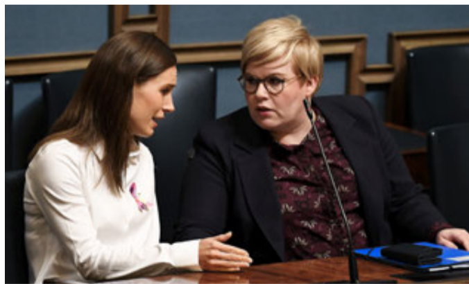
Sanna Marin (sd.) ja Annika Saarikko (kesk.) jakoivat velkarahaa kuin viimeistä päivää.

enemmän käteen. Että työllään pärjää eikä sosiaaliturvaan tarvitsisi tukeutua entiseen tapaan.