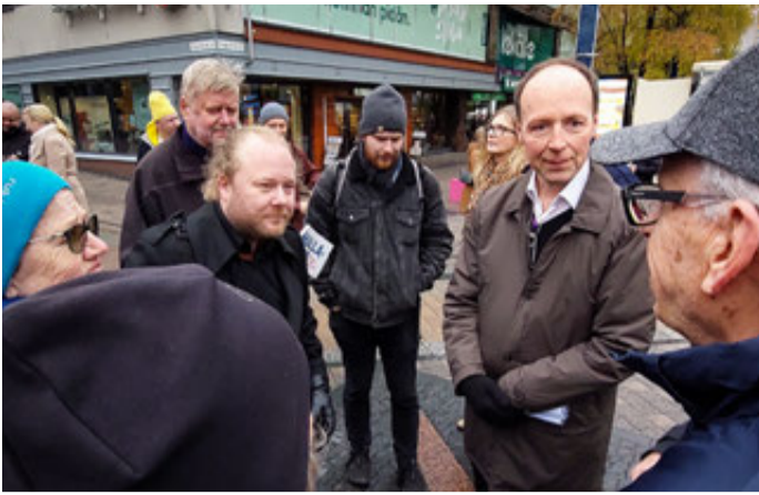
Presidenttiehdokas Jussi Halla-aho kävi mielenkiintoisia keskusteluja äänestäjien kanssa Jyväskylässä.