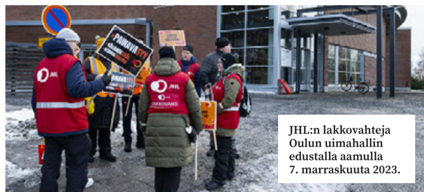
JHL:n lakkovahteja Oulun uimahallin edustalla aamulla 7. marraskuuta 2023.

joilla työpaikkojen syntymistä pyritään helpottamaan. Neuvotteluissa on kuultu erilaisia ehdotuksia. Selkävoittoja ei olla hakemassa, mutta nyt isänmaamme Suomi tarvitsee näitä toimia.