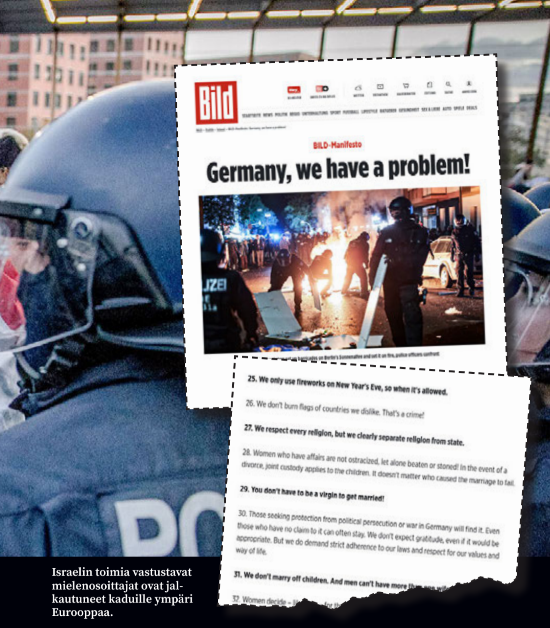
Israelin toimia vastustavat mielenosoittajat ovat jalkautuneet kaduille ympäri Eurooppaa.