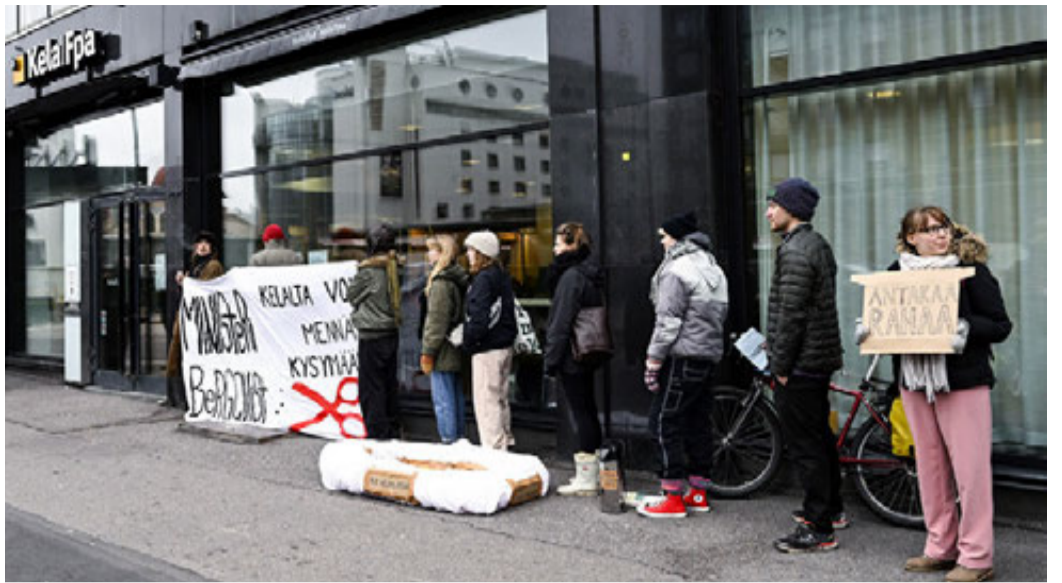
Opiskelijat järjestivät performatiivisen mielenosoituksen Kampin Kelalla Helsingissä 3. marraskuuta 2023.