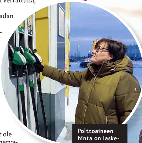
Polttoaineen hinta on laskenut Suomessa.