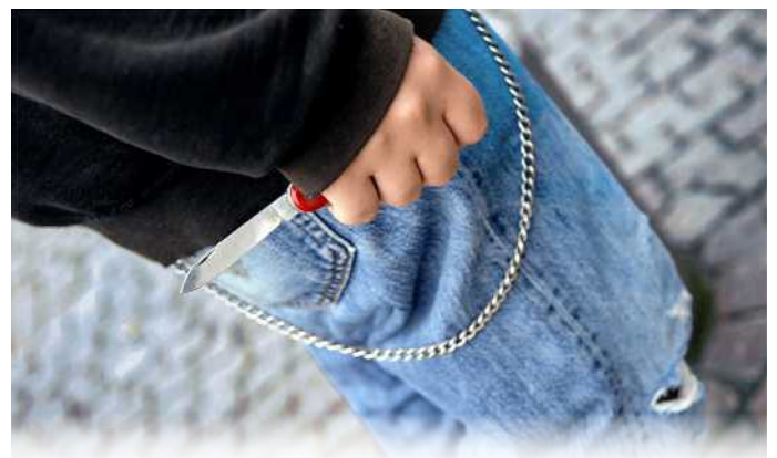
Teini-ikäiset jengiläiset varustautuvat teräaseilla. Kuvituskuva.

”Nyt maksetaan kovaa hintaa vihervasemmistolaisesta politiikasta.”