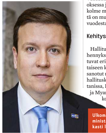
Ulkomaankauppa- ja kehitysministeri Vile Tavo seisoo tiukasti leikkausten takana.