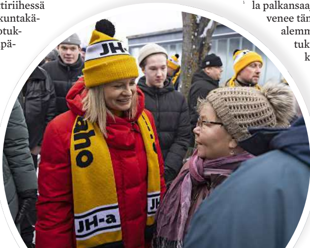
Valtiovarainministeri kuuntelee kansalaisia herkällä korvalla.