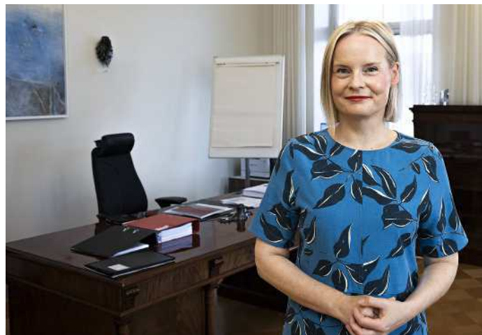
Kansalaiset seuraavat valtiovarainministerin toimia tarkkaan, ja palautetta tulvi eri kanavia pitkin.

"Kansalaiset haluavat, että pysymme kovana säästöjen kanssa."