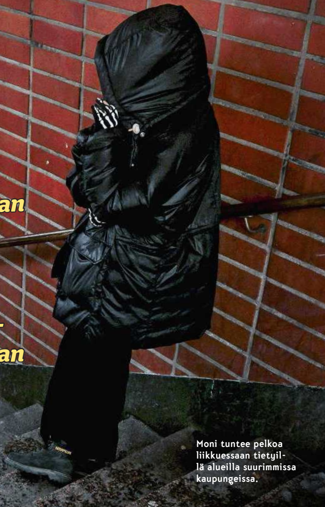
Moni tuntee pelkoa liikkessaan tietyillä alueilla suurimmissa kaupungeissa.

korkeampi kuin suomalaistaustaisilla nuorilla.