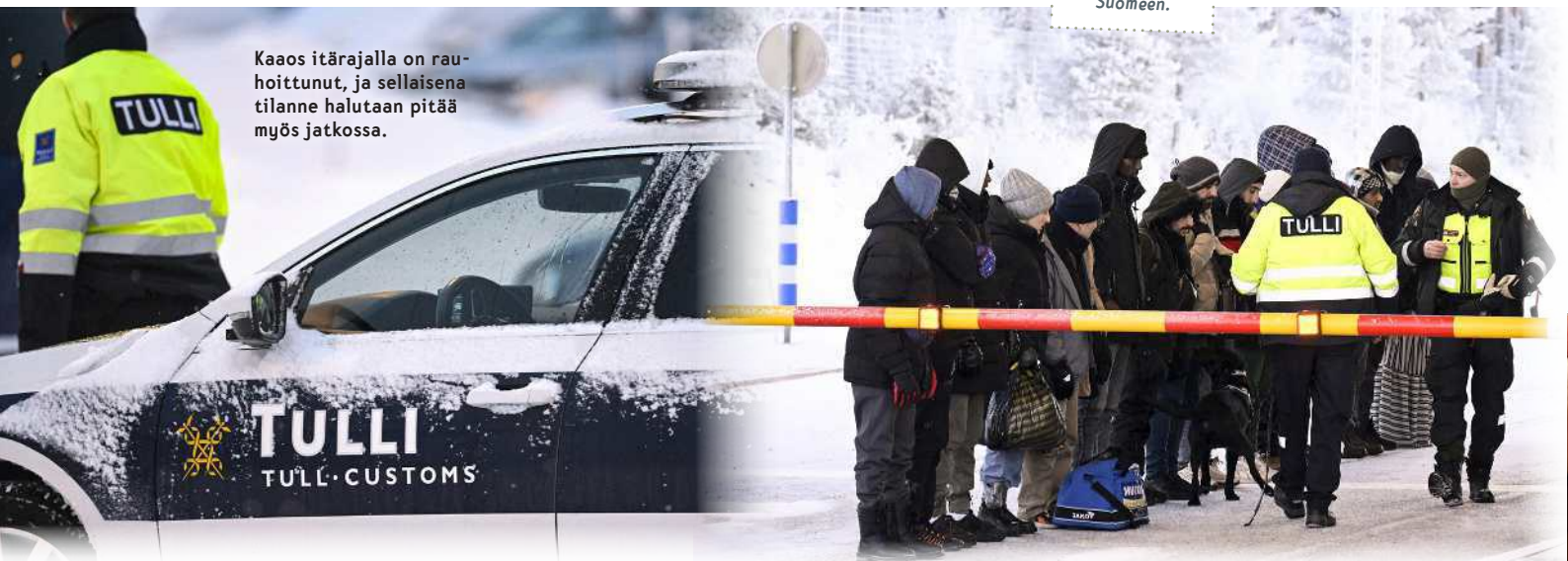
Kaaos itärajalla on rauhoittunut, ja sellaisena tilanne halutaan pitää myös jatkossa.

symys. Rajamenettely ei ole pikakäännityslaki eikä tältä osin käytettävissä tähän tilanteeseen, Rantanen selvitti.