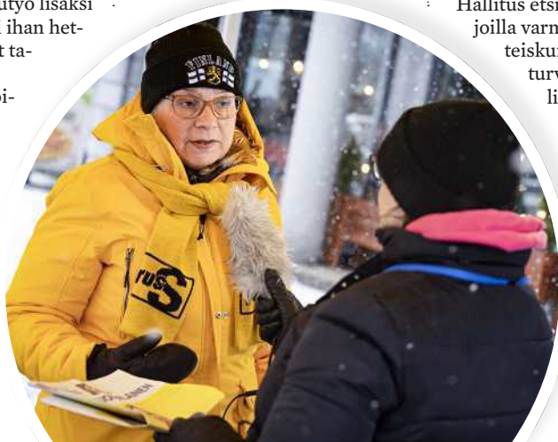
Leena Meri lupaa parannuksia kansalaisten oikeusturvaan.

- Kaikki peruslinjaukset muun muassa rikollisuuden torjumisessa, kuten rangaistusten riittävän kireä taso, vankilaverkoston kehittäminen, oikeudenhoidon resurssien varmistaminen sekä monet muut nyt muutettavat asiat, ovat sellaisia, että työtä tulee jatkaa johdonmukaisesti tulevina vuosina. Jos niitä lähdetään seuraavan hallituksen toimesta peruuttamaan tai jätetään asiat retuperälle, ei muutoksia ehdi tapahtua, vaan palaamme huonoon tilanteeseen – jota siis nyt yritetään hartiavoimin muuttaa.