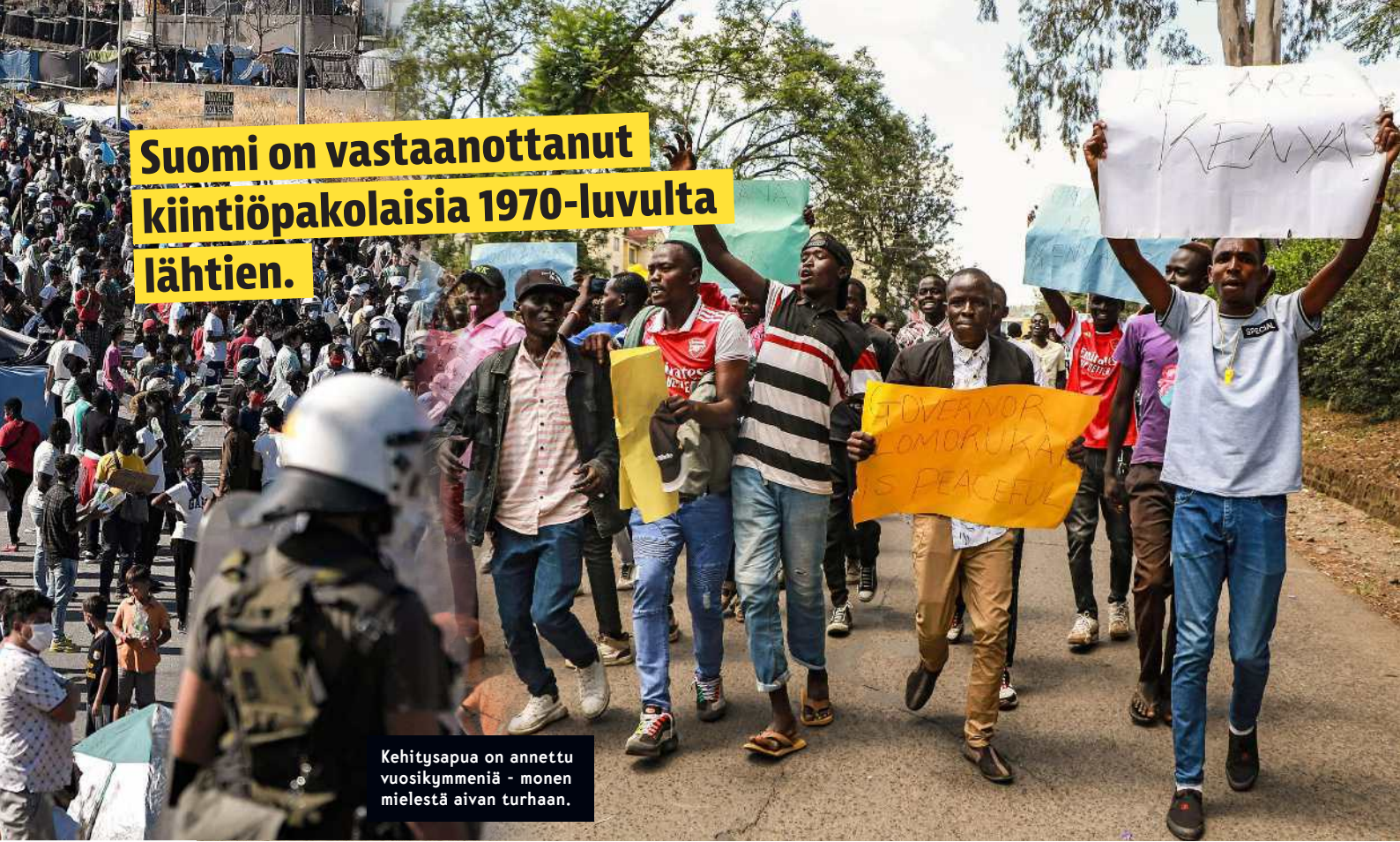
Kehitysapua on annettu vuosikymmeniä - monen mielestä aivan turhaan.

yhteistyöhön, josta vähennetään kehyskauden aikana yhteensä reilut 500 miljoonaa euroa. Monenkeskisen yhteistyön kokonaistaso laskee noin 160 miljoonaa euroa. Humanitaarista apua vähennetään yhteensä noin 130 miljoonaa euroa varsinaiselta kehitysyhteistyömomentilta.