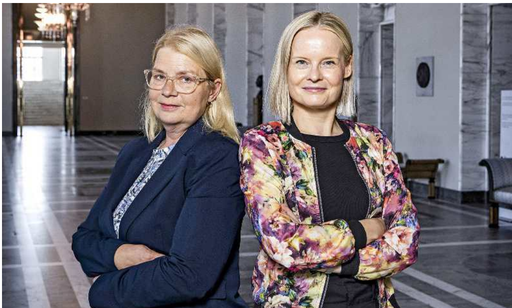
Leena Meri toimii perussuomalaisten I. varapuheenjohtajana, ja Riikka Purra on puolueen puheenjohtaja.