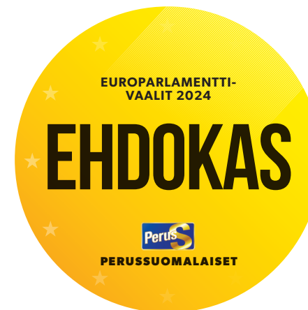
Rintanapit, selfie-taulut, tarrat