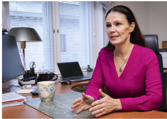
Liikenne- ja viestintäministeri Lulu Ranne kertoo hallituksen sitoutuneen tärkeisiin infrastruktuuriin.

rakentajana. Ministeriöillämme sekä virastoillamme on pitkä perinne erinomaisesta yhteistyöstä yli hallinnonalojen erityisesti puolustusministeriön ja Puolus-