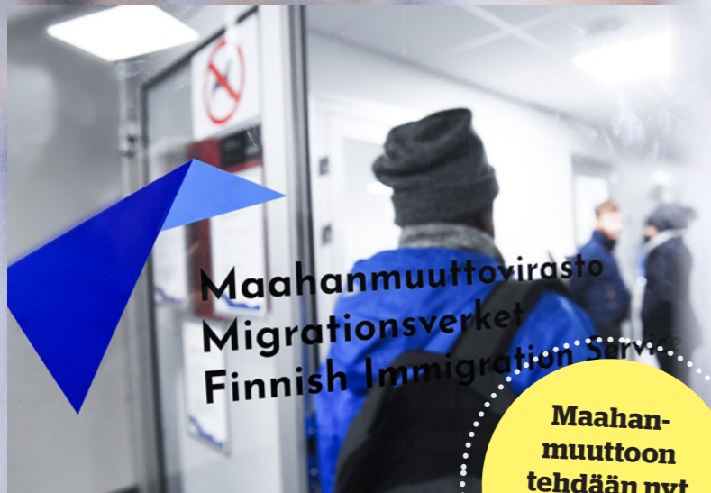
Maahanmuuttoviraston ovi kävi turhan tiuhaan edellisen hallituksen aikana.

Maahanmuuttoon tehdään nyt merkittäviä kiristyksiä.