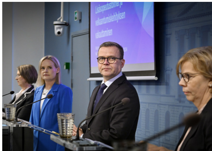
Hallituksella on täysi työ laittaa valtiontalous kuntoon ja luoda edellytyksiä työllisyydelle ja talouskasvulle.

pistetaan 1,6 miljardia euroa vuonna 2028. Veronkorotuksien staattinen bruttovaikutus on 1,8 miljardia euroa vuonna 2028.