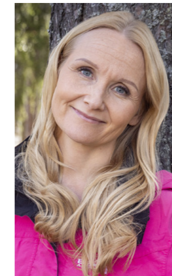
- Uudenlainen isänmaallinen ja konservatiivinen Eurooppa on tavoitteeni, Garedeu kertoo.

kolaisopimuksia solmittaessa. Garedeu keskeyttäisi turvapaikkahakemusten vastaanottamisen, jos sen taustalla on vieraan valtion vaikuttamisyritys.