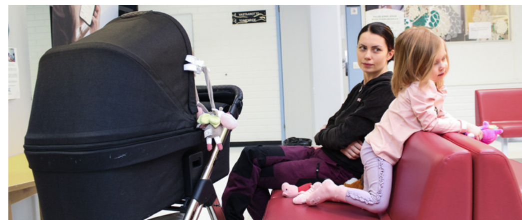
Palveluiden on oltava saatavilla ja mielellään melko lähellä, kun perheessä on pieniä lapsia.

- Tuntuu siltä, että koronapandemian jälkeen moni asia on mennyt huonompaan suuntaan Suomessa. Oma mummokin täyttää 90 vuotta ja pelkää, mitä ta-