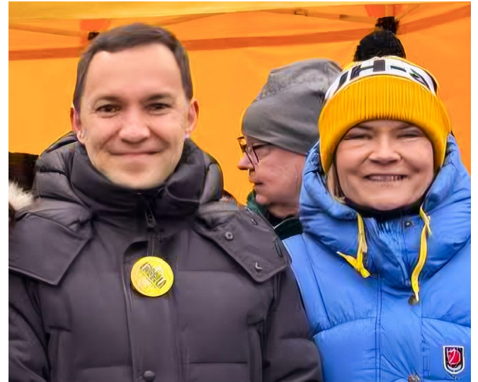
Helsingistä jatkokautta eduskunnassa hakee peräti kaksi ministeriä: Wille Rydman ja Mari Rantanen.

Ensimmäiset Helsingin perussuomalaiset eduskuntavaaliehdokkaat julki: