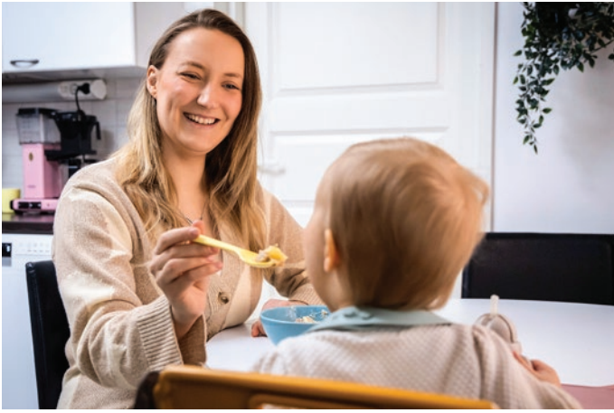
Kahden pienen lapsen kanssa riittää tekemistä.

Suomalaiseen perhearkeen sujuvuutta veronkevennyksillä ja valinnanvapaudella