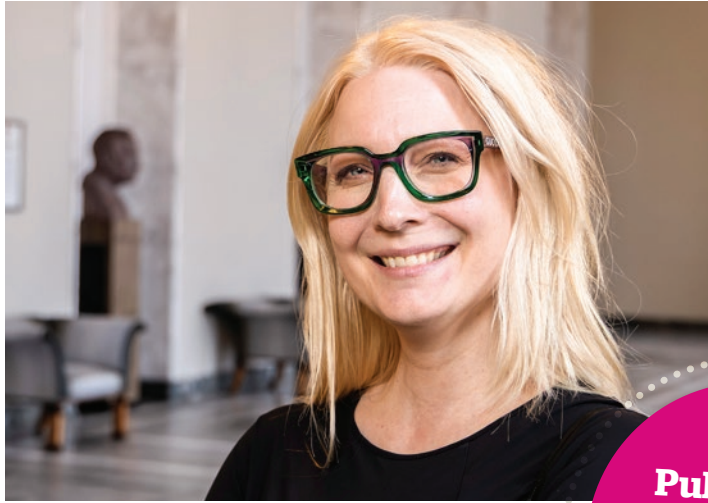
Kansanedustaja Laura Huhtasaari nauttii uudesta aluevalloituksestaan.

"Me olemme tekijäkansaa. Ajattelin, että alan tehdä kaikkea. Olen aina kokenut olevani luova ja taitava käsistäni."