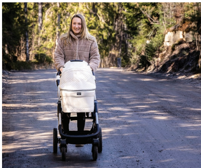
Kivistö on tyytyväinen perhepolitiikan asenneilmapiiriin kuntatasolla.

TEKSTI PS TOIMITUS