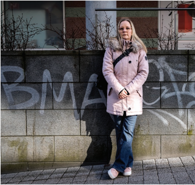
Turvattomuus ja varautuminen on tuttua Pirhosenkin perheelle.